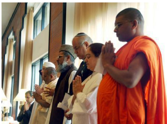
다른 종교와의 일치

소금은 부패를 막는 기능을하도록 그리스도인은 세상에서 하나님의 백성으로서 거룩한 소금의 역할을하도록 부름 있습니다. 그러나 현재 교회는 다른 종교와의 융합과 협력하여 진리에서 벗어나 완전히 소금기를 없앤 존재가 되어있는 것은 아닐까요. 시간을 깨닫지 않으면 안됩니다.