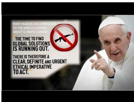
성경에 오류가 있다고 말하는 카톨릭

교황 숭배, 마리아 숭배의 교회 카톨릭을 하나님의 말씀 위에 두는 터무니없는 이단 교리입니다. 그들은 따라 천주교를 받아들이는 사람들은 모두 멸망의 넓은 문으로 들어가 "배보다 더 큰 지옥의 자식"이 될 것입니다. 결론적으로 그들은 거짓 교사의 재앙 때문에 지금의 시대의 교회에서도 멸망의 문 멸망의 길이 넓습니다. 우리는 가르침을 음미 생명의 좁은 문, 좁은 길을 어떻게 든 찾아내는 수 있도록 요구합니다. 왜냐하면 그것을 "그것을 찾는 사람은 드문"이기 때문입니다. - 이상 -