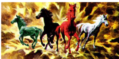
묵시록의 4 마리의 말

그리고 그 죄에 따라 밀과 보리 곧 하나님의 말씀이 귀중품이 높은 가전을 지불하지 않으면 살수없는 것으로 될 예언되어 있습니다. 또한, 올리브 기름과 포도주 즉 성령의 역사에 해가 추가 될 날이 온다. 이와 같이 종말 배교의 교회에 온 응하는 싸움과 재앙을 말하는 것 인 것입니다. 제대로 깨달음합시다. 이상