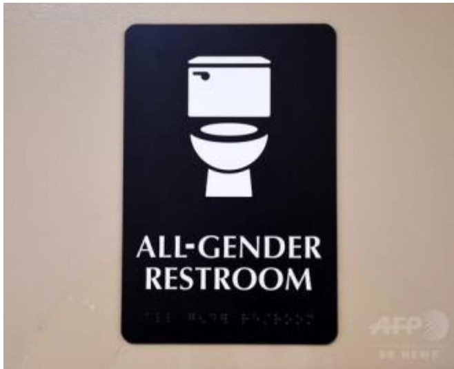
게이 화장실 마크